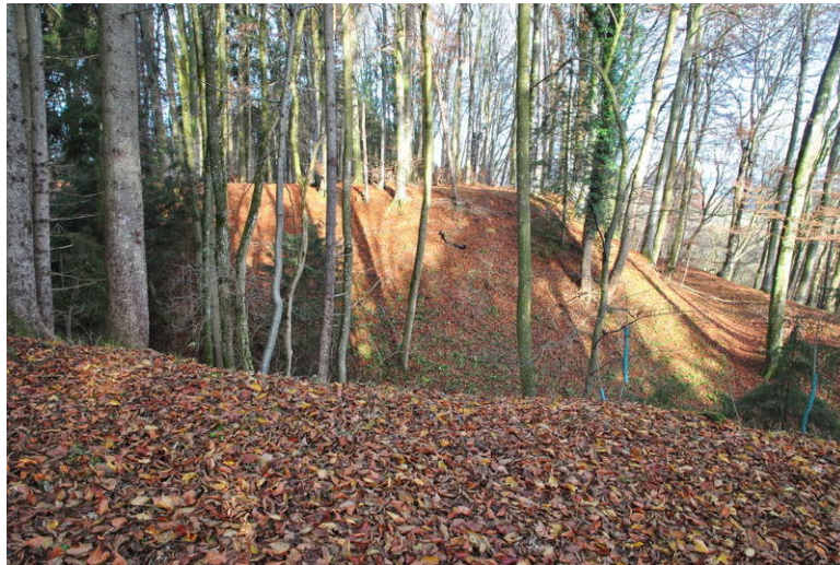
Burgstall in Unterschöneegg